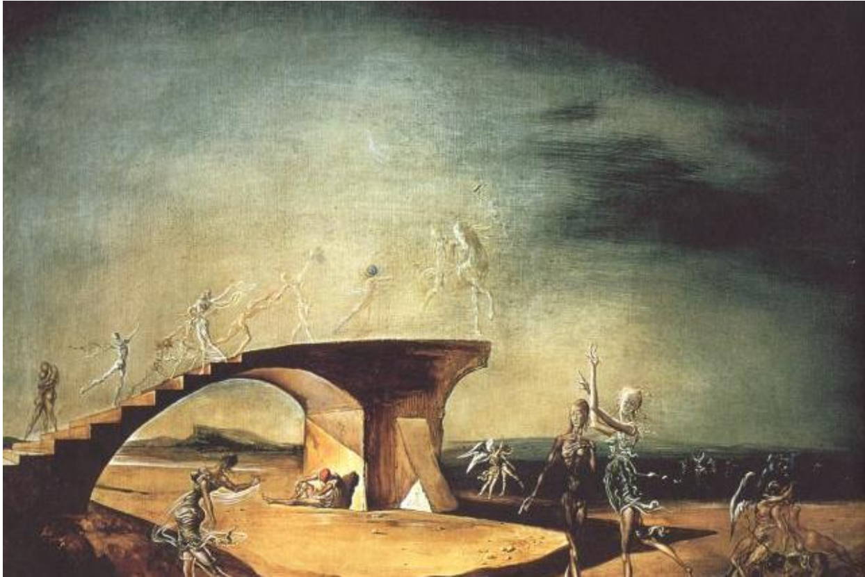
“The broken bridge and the dream”, Salvador Dali, 1945