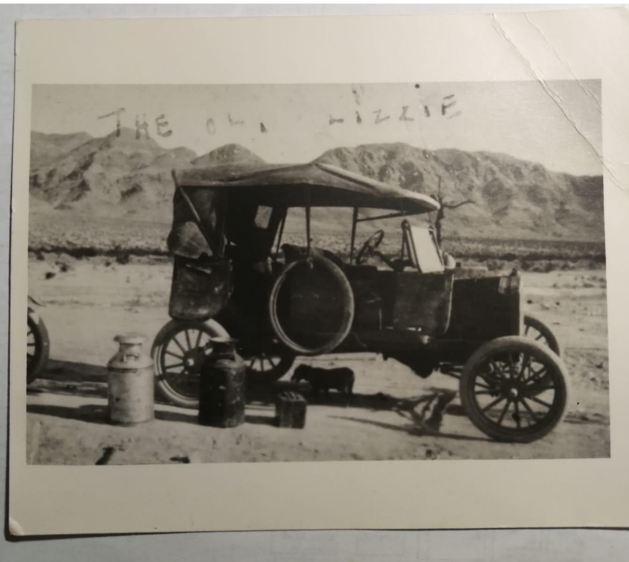
The "Old Lizzie"