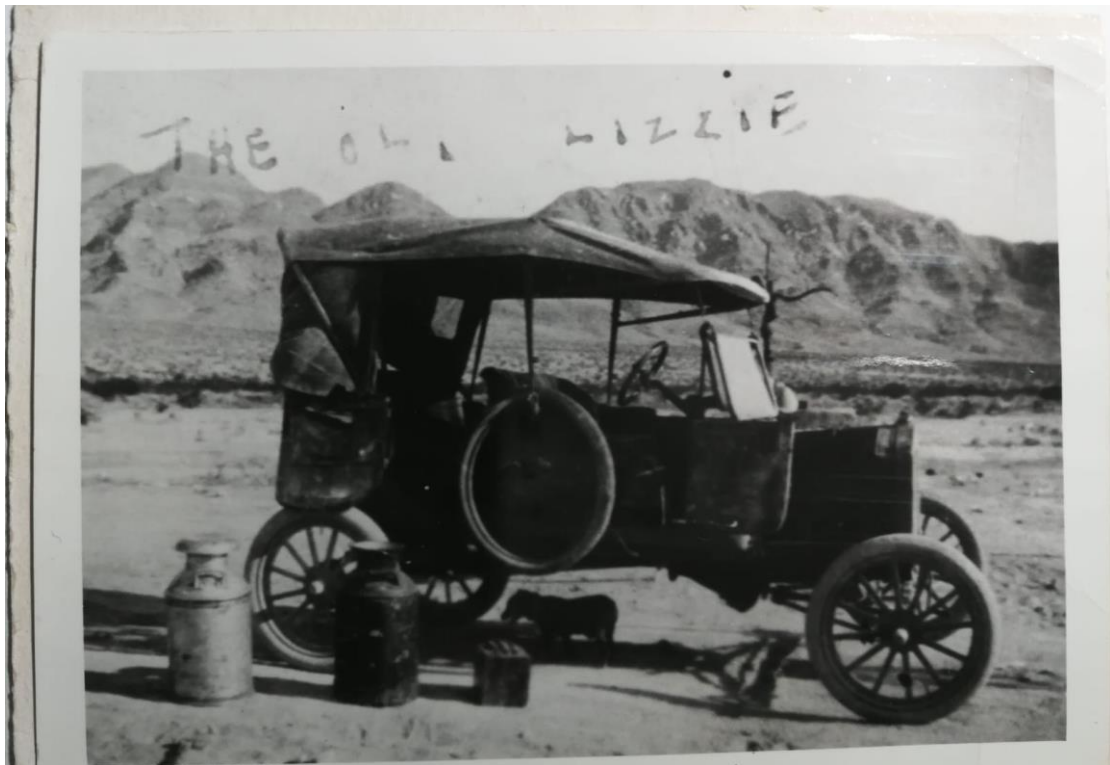
עבודת גמר בהיסטוריה