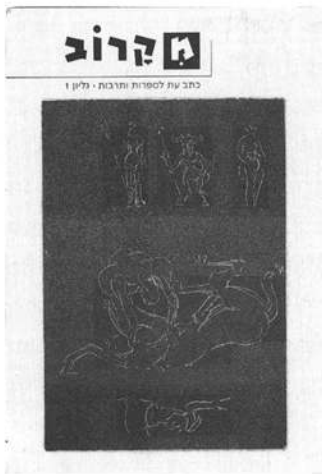
'מקרוב, כתבי'עת לספרות ותרבות', עורכים גדי טאוב ונסים קלדרון, גיליון 1, חורף 1997, הוצאת הקיבוץ המאוחד.

+ בהארץ מתפרסמת מדי יום מודעה המונה את ימיו של אחמד קטאמש במעצר מינהלי. < אחרי 19 שנה מחליט היועץ המשפטי לממשלה לערוך משפט חוזר לאנשי "כנופיית מע'צ" משכונת התקווה, מתוך חשד שהופללו בזמנו על ידי