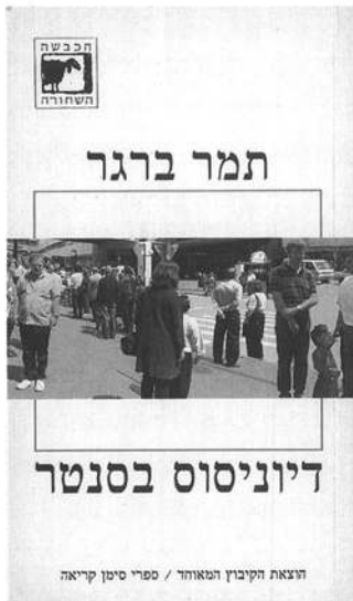
'דיוניסוס בסנטר' מאת תמר ברגר, ספרי הכבשה השחורה, הוצאת הקיבוץ המאוחד / ספרי סימן קריאה. המאוחד / ספרי סימן קריאה.

שכר הלימוד ושינוי סדר העדיפויות יובילו לבסוף לשביתת הסטודנטים באוקטובר, שתדחה את פתיחת שנת הלימודים במספר שבועות. 9 הזמרת דנה אינטרנשיונל זוכה במקום הראשון בתחרות הארוויזיון; הקהילה ההומוריסטית מצינת את הזכייה באותו לילה בחגיגה ספונטנית בכיכר רבין. יאיר קדר כותב בהעב: ליל הזכייה הוא "הלילה המשמעותי ביותר שחוותה הקהילה ההומוריסטית בארץ, ליל סטונוול הישראלי". 11 הממשלה מכירה לראשונה בג'ונתן פולארד כסוכן ישראלי. 12 אהוד ברק עורך מסע לחיפוש תמיכה בהתנחלויות ומצהיר: "בית אל ועפרה יישארו בידינו תמיד". 13 חיירי עלכם נרצח בשכונת בית ישראל בירושלים, הפלסטיני השישי שנדקר בירושלים תוך שלושה חודשים. המשטרה חוששת שמדובר בדוקר סדרתי. 14 חמישה פלסטינים נהרגים מירי חיילי צה"ל ומאות נפצעים במהלך תהלוכות המוניות הנערכות בשטחים לציון יובל ל"אל נכבה". 15 בעצרת בנצרת לציון יום "אל נכבה" מושמע הנאום המרכזי של מחמוד דרוויש מקלטת: "כמו שיש ליהודים זכות לדרוש מאירופה את הנזק שנגרם להם בשואה, כך זכותנו לדרוש מהישראלים את הנזק שנגרם לנו". 22 משתתפים באירוע ה"וויגסטוק" של הקהילה ההומוריסטית בתל-אביב חוסמים צומת ומתכנינים על-ידי שוטרים לובשי כפפות. 25 עמותת "רופאים לזכויות אדם" פותחת מרפאה לעובדים זרים בתל-אביב.