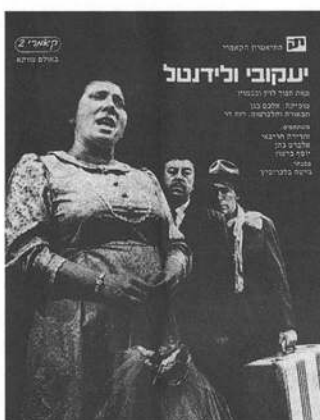
'יעקובי ולידנטל', מחזה מאת חנוך לוין ובבימויו. כרוזה להצגה בתיאטרון הקאמרי.

דגים. עולם הקולנוע: התופעה יכולה "לגרום ליאוש אצל כל חובב תיאטרון אמיתי... הקהל הרחב... קבע את הסגנון והאופי של עונת התיאטרון... הומור עממי מאוד, ים תיכוני מאוד". < מופיע גיליון ראשון של סימן קריאה, רבעון מעורב לספרות. העורכים, מנחם פרי ומאיר ויזלטיר, קובעים כי "המתווה הספרותי בארץ אין לו מסגרות משמעותיות... מיטב המתווה בספרות מפורד ומשוע עד כדי כך שהוא מגיע אל הקורא בתוך בליל אמורפי של קשקוש גראפומני, דילטאנטי או כמו למדני".