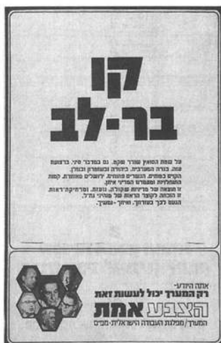
"קו בר-לב". מודעת בחירות של המערך, 'הארץ', 19.9.73.