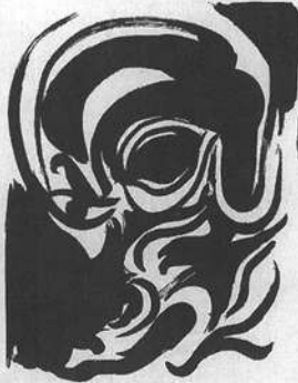
'קה', שירים, מאת מאיר ויזלטיר, 1969 - 1970, ספרי סימן קריאה, מפעלים אוניברסיטאיים להוצאה לאור, תל-אביב.