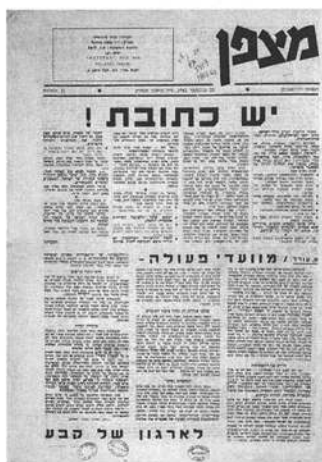
'מצפן', עורך עודד פילבסקי, גיליון 1, הוצאה חר'פעמית, 21.11.62.

ולמודים מקצועיים. בבאר־שבע מופעלת באופן ניסיוני תוכנית מיון תלמידים לכיתות, לפי הישגיהם. השינויים נועדו, לדברי שר החינוך, להתמודד עם הגידול המהיר בביקוש לחינוך תיכוני, מבלי לפגוע ברמת בחינות הבגרות. א. בן־אברהם מתריע במערכה מפני השינוי, אולם מודה כי הוא מבטא "מהפכה בפסיכოזה שקבעה כל השנים שהורים רבים, בעיקר יוצאי ארצות האיסלאם, אינם מתאמצים להקנות לבניהם חינוך על־יסודי מחמת היעדר מסורת כזו בארצות מוצאם, וכן מחמת להיטותם להוציא את בניהם בגיל צעיר אל שוק העבודה". 18 אל איתחאב מדווח על כוונה לגרש את בני השבט הבדווי אל הואשלי מאדמותיהם שעל יד דימונה. כעבור חודש יגרשו אנשי הממשל הצבאי שבע מאות וחמישים מבני השבט באישון לילה ויהרסו את בתיהם. 5,000 דונם יופקעו ועוד 3,000 יימסרו לחסן אבו רביע, בדווי המקורב לממשל הצבאי. 21 מתחילים בבניית כפר חדש, בית נקופה, על אדמות הכפר בית נקובה שעל יד אבו ע'וש, שבו גרו תושבי הכפר החדש עד עתה. + דיבה להשכיב, קומדיה על זוג ישראלי צעיר המחפש דירה בעיר. < נוסד "מחברות לשירה", בית הוצאה לשירה מודרניסטית, בעריכת דן צלקה. מוציא לאור ארבעה קובצי שירה, של אמיר גלבע, נתן זך, דליה רביקוביץ וישראל פנקס. < בצורת מתקיים קונגרס הפלאחים הערבים.