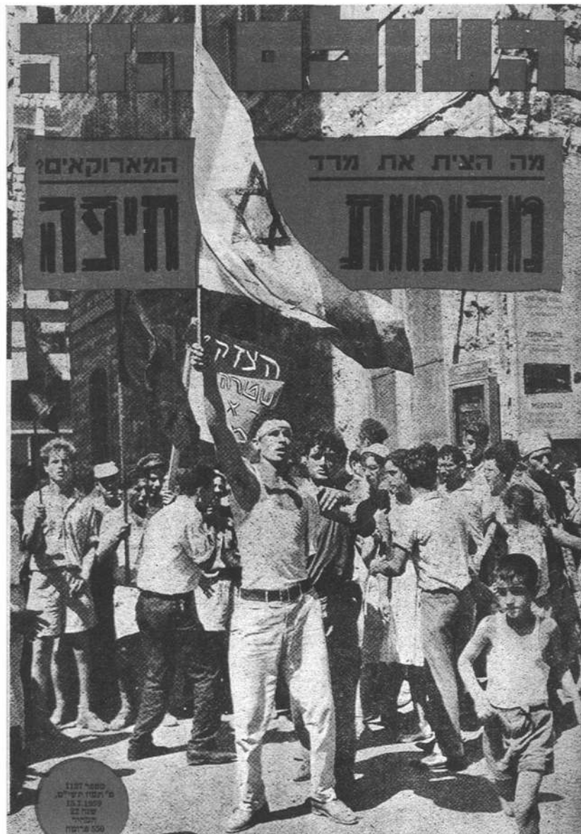
"מהומות חיפה", תצלום מהפגנה בוואדי סאליב, שער 'העולם הזה', 15.7.59.

ציוני והפרוטקציוניזם שימשו כמנגנונים מוסתים בעימותים פוליטיים. משמעות הדבר היתה שהנגישות למוקדי כוח וההשתתפות בחלוקת הנכסים הפוליטיים היו פתוחות לאלה שהיטיבו ליצור קשרים מתאימים. תשומת הלב הפוליטית התרכזה, החל ב-1954, במאבקי העוצמה חסרי התקדים שהתחוללו בראש הפירמידה השלטונית והתמקדו ב"פרשת לבון".