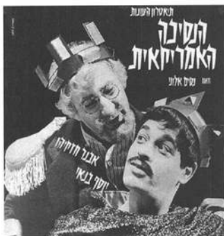
'הנסיכה האמריקאית', מחזה מאת נסים אלוני ובבימויו. עטיפת תקליט לפס קול ההצגה בתיאטרון עונות, סטודיו ב. חובב.