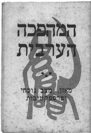
"המהפכה הערבית, מאזן מצב נוכחי ופרספקטיבות", דפים אדומים, מספר 9, פרסום הליגה הקומוניסטית המהפכנית, הוצאת דפים אדומים.

התפטרותה. מאיר: "אינני מסוגלת לשאת בעול הזה". < שמונה עשר הרוגים בפיגוע מחבלים בקרית שמונה. > תנועות המחאה של מלחמת יום הכיפורים מתאחדות ל"תנועת ישראל שלנו". < 22 > יצחק רבין גובר על שמעון פרס בהצבעה במרכז מפלגת העבודה על מועמד המפלגה לראשות הממשלה. בסמוך למועד ההצבעה הפיץ עזר ויצמן מזכר, שבו דיווח על התמוטטותו של רבין הרמטכ"ל, בסוף תקופת ההמתנה לפני מלחמת ששת הימים.