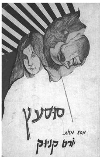
'סוס עץ', מסע מאת יורם קניוק, ספרית פועלים, הקיבוץ הארצי, השומר הצעיר.

+ רואים אור: אחדות העבודה 1919–1930, מאת יוסף גורני; מסכת הרומן והסיפור האינפוארי, מאת ברוך קורצוויל.