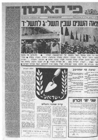
"מאה השנים שבין תשל"ג לתשל"ד", 'פי האתון', שבועון הסטודנטים של האוניברסיטה העברית בירושלים, 22.4.74