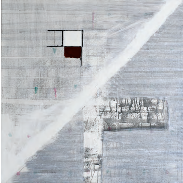
זוהדי קאדרי שריפה מחודשת של הכאב | 2018 טכניקה מעורבת, 75X75 ס"מ